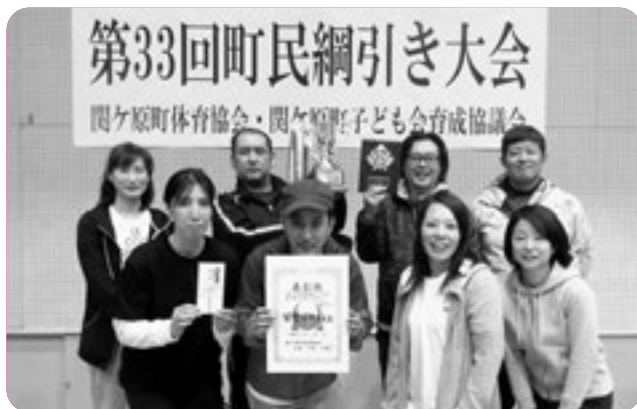
一般の部 優勝 北部消防団と奥様たちチーム

子ども会の部 優勝 小池Aチーム 準優勝 六反田チーム 3位 稲若隊チーム 敢闘賞 笹尾チーム