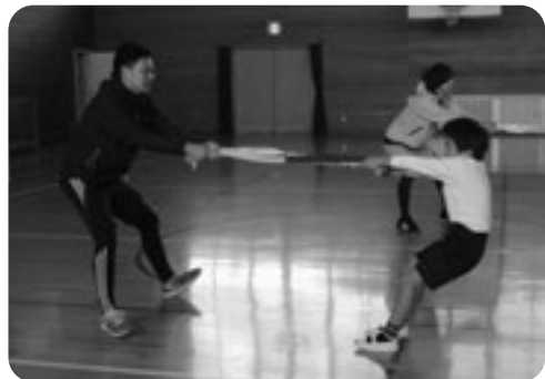
タオルで綱引き！どっちが勝つかな！？