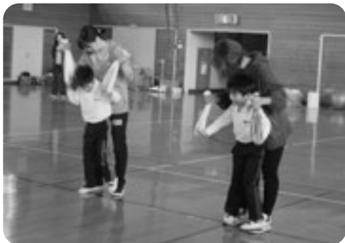
大人の足の上に乗って、ロボット歩き？！