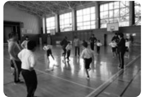
片足立ち、お父さんよりも長くできるよ！