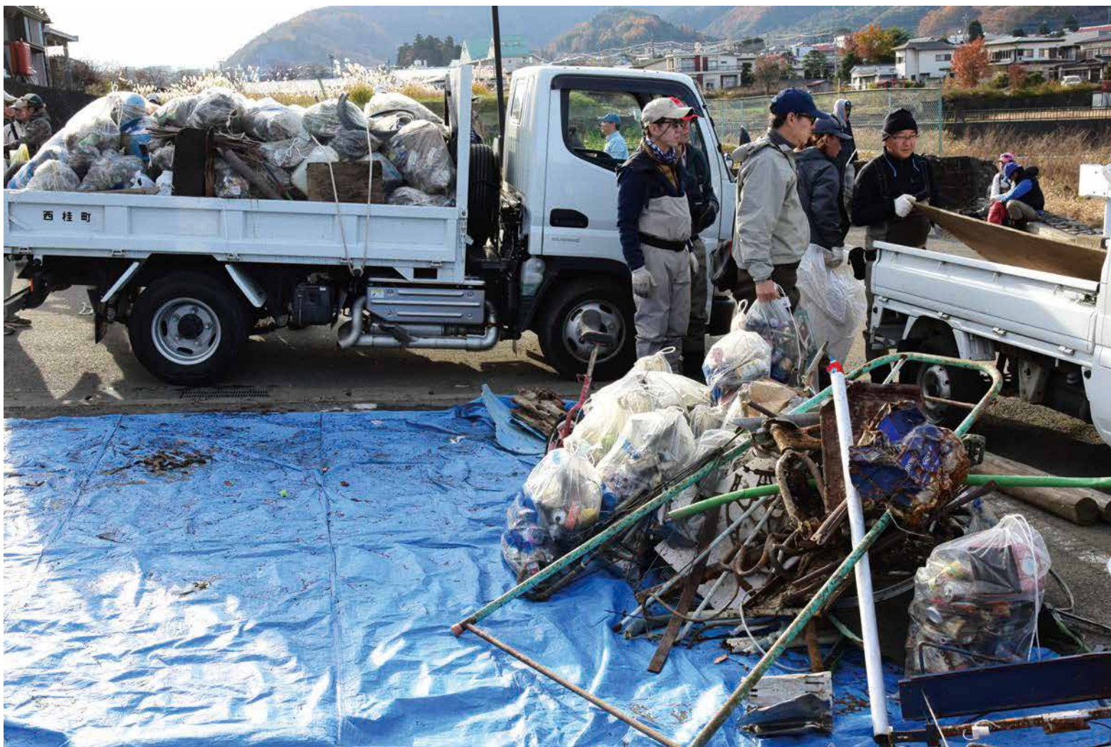
□ 桂川清掃活動で回収されたゴミはトラック二台分になった。

12月2日3日は全国の町村が一堂に会した物産展「町イチ！村イチ！」が東京国際フォーラムで開催されました。西桂町も参加しストールや傘、ネクタイなどを展示販売しました。展示会に参加したことで西桂町の織物の繊細さや、一つ一つ丁寧に作られている物作りの姿勢を感じることができましたし、商品を手にとったお客さんの反応も非常に良かったと思います。（株）植田商店と東京造形大学が共同制作した日光写真傘もお客さん達から高い評価をもらえ、商品化に向けた手応えを感じました。