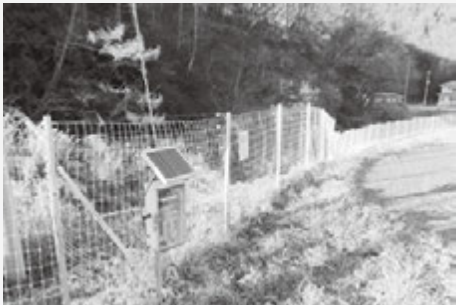
尾尻地区・電気柵

において、電気柵管理組合および近隣耕作者からの要望により、尾尻地区河川沿いの約613mに電気柵