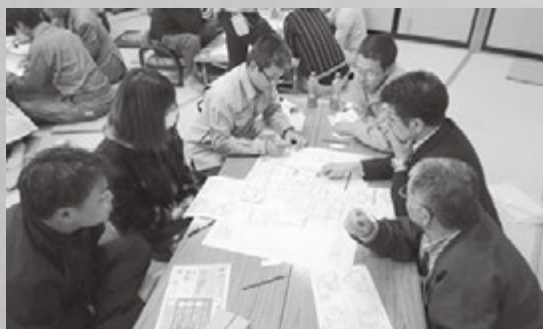
上町地区・防災研修会

推進事業・防災研修会」を開催し、県防災アドバイザーから避難所運営について学びました。 当日は、講義や図上演習を実施し、避難者を中心となり運営する避難所運営について、図上訓練、防災訓練を繰り返し行うことで災害への備えとなることを確認したところであります。