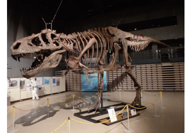
ティラノサウルス「スコッティ」 全身復元骨格（レプリカ）

国立科学博物館（東京、上野公園）で開催される「恐竜博 2019（7/13-10/14）」で穂別博物館収蔵の化石・全身復元骨格（レプリカ）が複数展示されます（写真で示したものなど）。むかわ竜は恐竜博 2019 の 2 大メイン恐竜の一つとして扱われます。展示の第 4 章「むかわ竜の世界」では、むかわ竜以外にホベツアラキリュウとフォスフォロサウルスの化石・全身復元骨格が展示されます。ホベツアラキリュウ発見後の 1982 年から博物館に学芸員を配置し、調査・研究を進めてきた（旧）穂別町・むかわ町の活動成果の一端を東京で見られる数少ない機会となります。