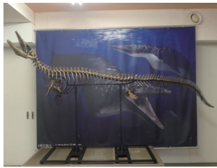
フォスフォロサウルス 全身復元骨格（レプリカ）