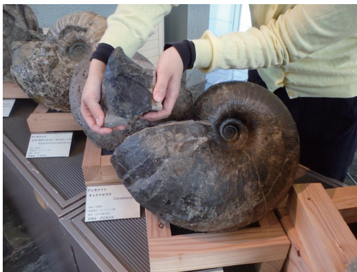
発見された顎器と 40cmのゴードリセラス殻

アンモナイトは殻だけでなく顎器（イカ・タコではカラストーンビ）も化石として残ることが知られています。