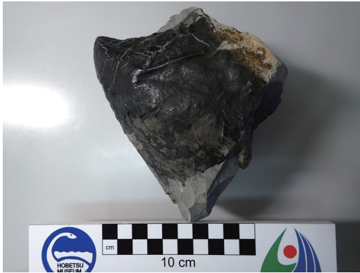
発見・寄贈されたアンモナイトの下顎