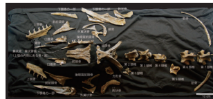
フォスフォロサウルス（実物化石）