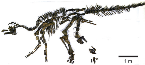
むかわ竜全身骨格（実物化石）