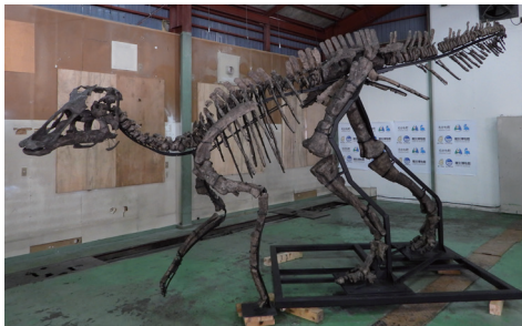
むかわ竜全身復元骨格（レプリカ）