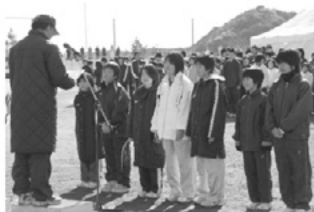
小学生女子の優勝 海部JVC