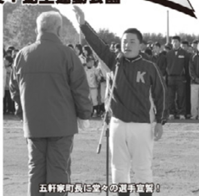
五軒家町長に堂々の選手宣誓!