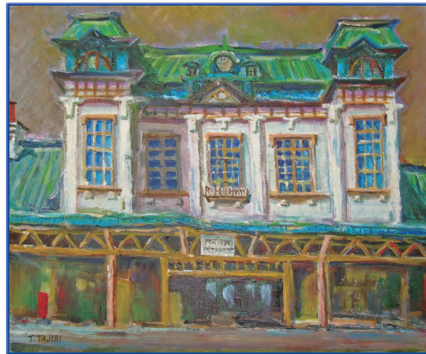
画/田尻 雄彦 (表紙裏面にプロフィール)