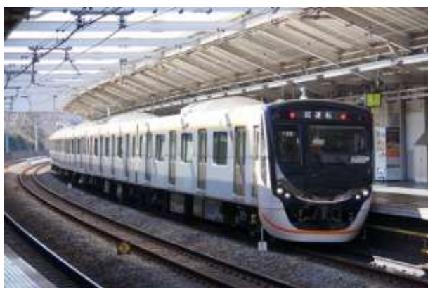
▲大井町線新型車両6020系