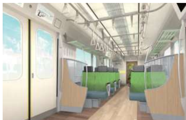
▲新型車両6020系車両内装イメージ(クロスシート状態)