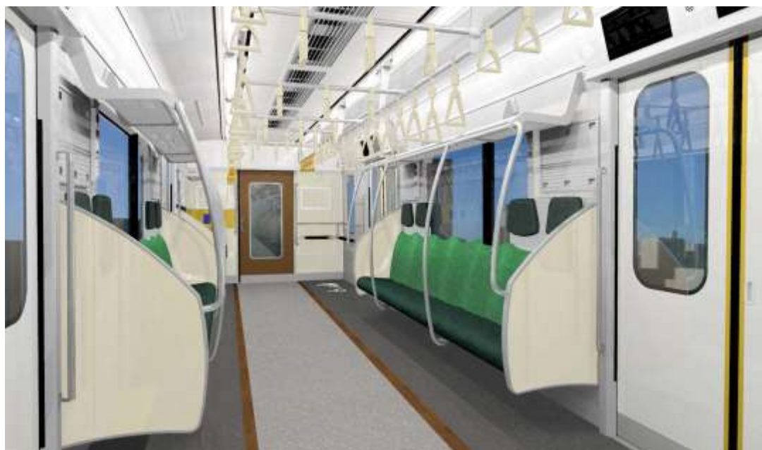
6ドア車両から置き換える4ドア車両の客室内イメージ