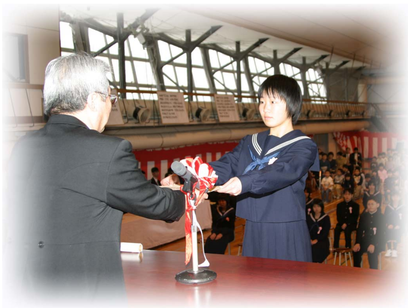
天塩小学校卒業式／平成19年3月20日撮影