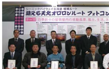
ラルズプラザ留萌店で表彰式が行われました。

萌える天北オロロンルート 運営代表者会議事務局 電話：0164-42-3871 FAX：0164-42-2200 mail：tenpoku-ororon@moeru.fm blog：http://fine.ap.teacup.com/moetenororon/