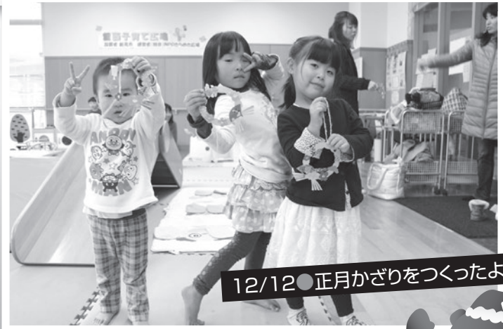
12/12 ●正月かざりをつくったよ!