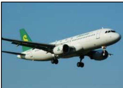
春秋航空 エアバス A320 型機