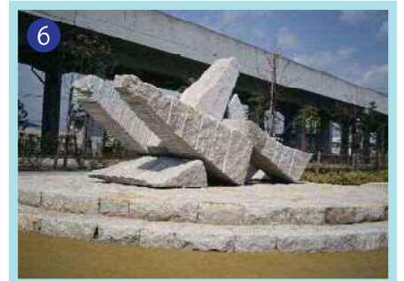
組曲「海」億万年の忘れ物 寺田武弘