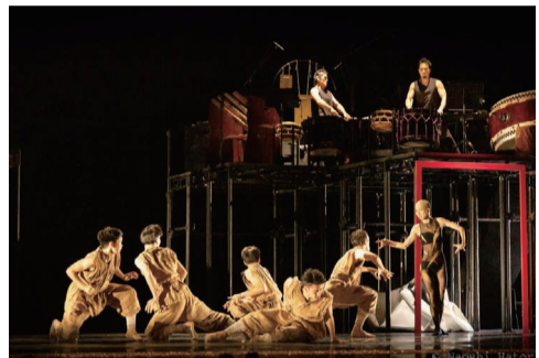
ノイズム&鼓童の「鬼」