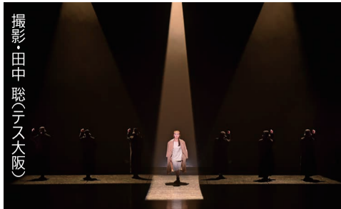
「空想という名の列車に乗って」