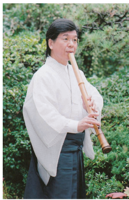
人間国宝・野村峰山(都山流尺八竹琳軒大師範)

名古屋在住の尺八奏者・野村峰山(65歳)が、重要無形文化財保持者(いわゆる人間国宝)に認定された。1954年の制度開始以来、東海地区での芸能部門認定は初。尺八奏者としては6人目。ことし峰山と同時