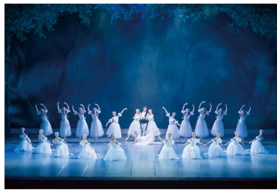
「シヨビニアーナ」