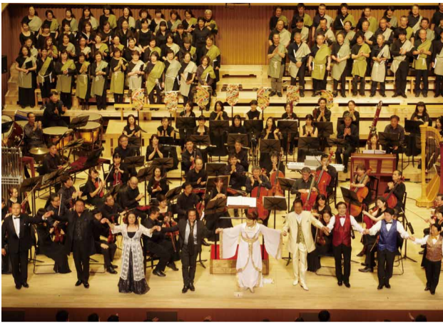
名古屋テアトロ管弦楽団/合唱団