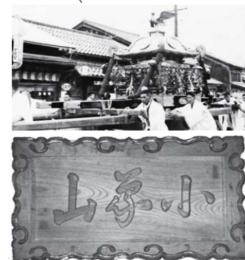
震災以前の神門に掲げられていた扁額

当社の大神輿は一トンを優に超える重量があり、五十年前の百五十年祭の折に台車が造られてからは、ほぼかついで巡行することなく今日に至っています。神輿をかついで祭りを盛り上げようと決起していただきました。