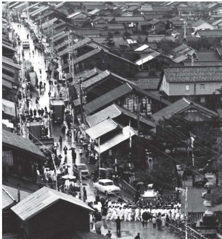
昭和36年 150年大祭 神輿渡御祭

「小象山神輿会」の御山の名称が小象山であると聞いて、「あの御神輿、ほんとうに小さい象ぐらい重いしなあ。」とふさわしい名前に全員一致で即決となりました。