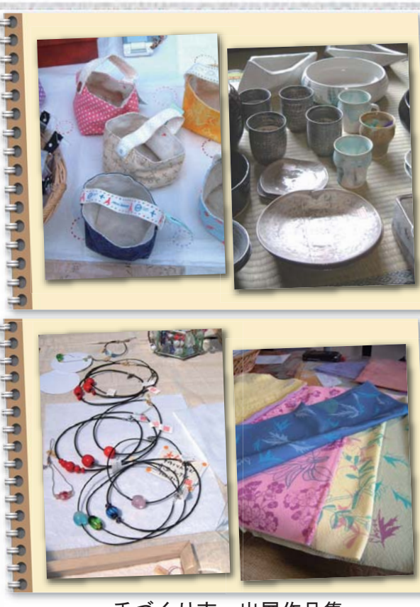
手づくり市 出展作品集

こんぴら 手づくり市 のんびり ゆったり。手づくり市は、 みんがづくるとてもです。 出展者募集中!! 毎月第3日曜日 開催中! 朝10時～夕方3時頃まで 7/18 8/22 9/19 10/17 11/21 12/19 開催予定。