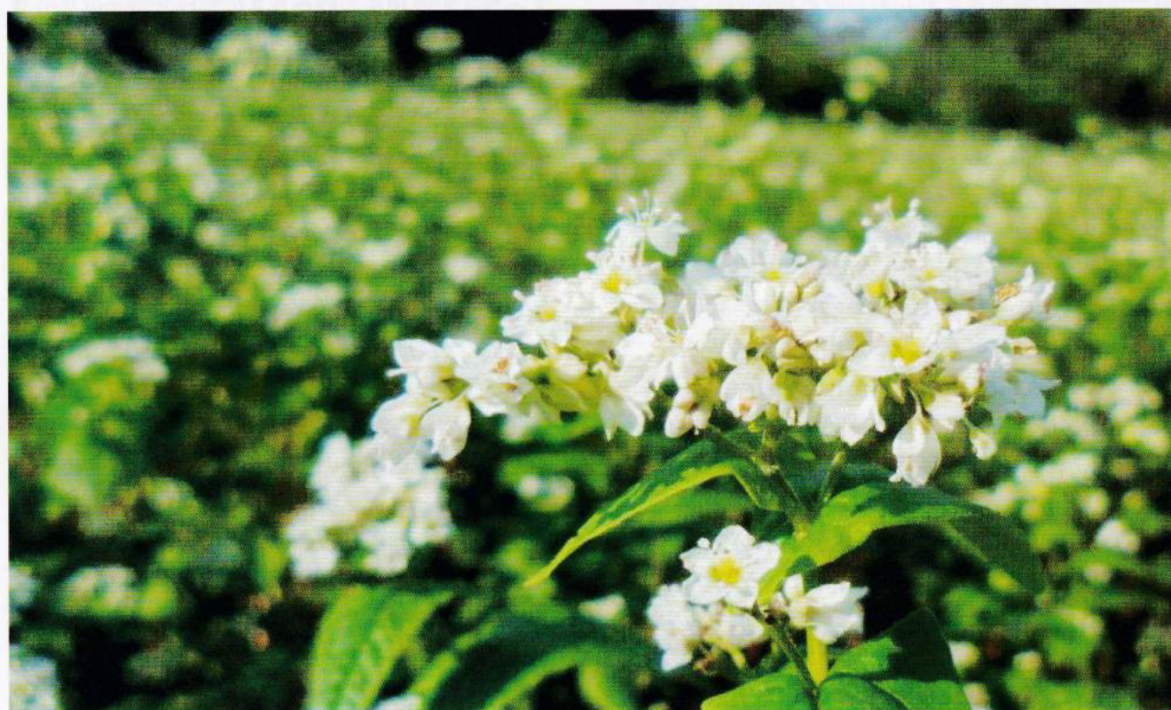
ソバの花 (深大寺界限にて)

患者様やご家族の側に立った医療 患者様の社会復帰を目指す医療 全職員相互の力を発揮できる医療