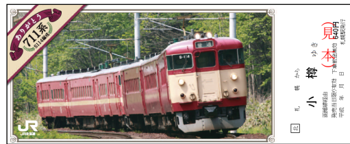
（札幌→小樽の片道乗車券／S114 編成）