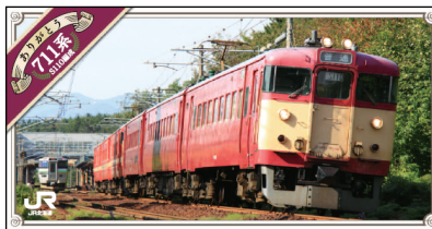
（札幌→旭川の片道乗車券／S110 編成）