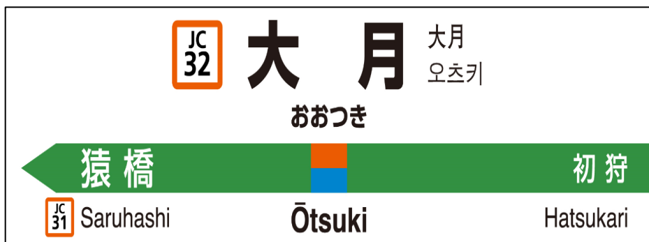
(駅ナンバリング・ホーム駅名標イメージ)