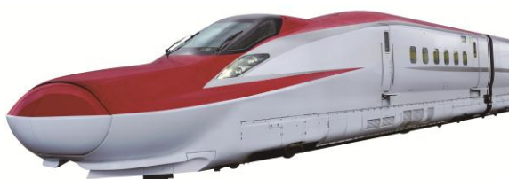
〈 E6系車両 〉