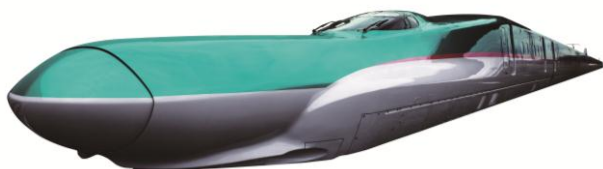
〈 E5系車両 〉