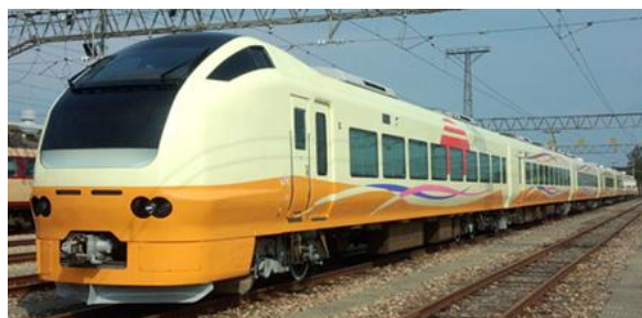
〈 E653系車両 〉

新潟～秋田間運転の特急「いなほ」3往復全てに、E653系を導入し到達時分の短縮と快適性の向上を図ります。 東京～羽後本荘間は、これまでよりも最大16分短縮します。