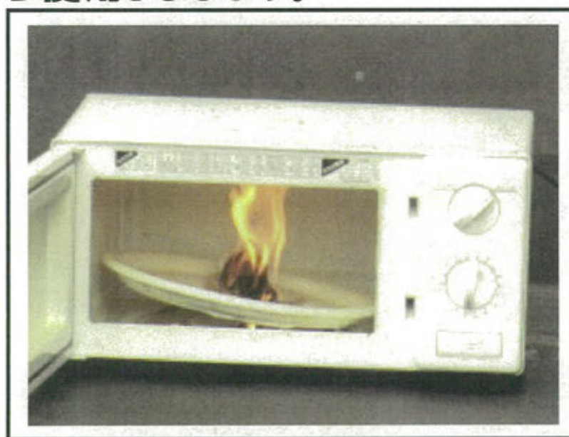
再現実験による状況