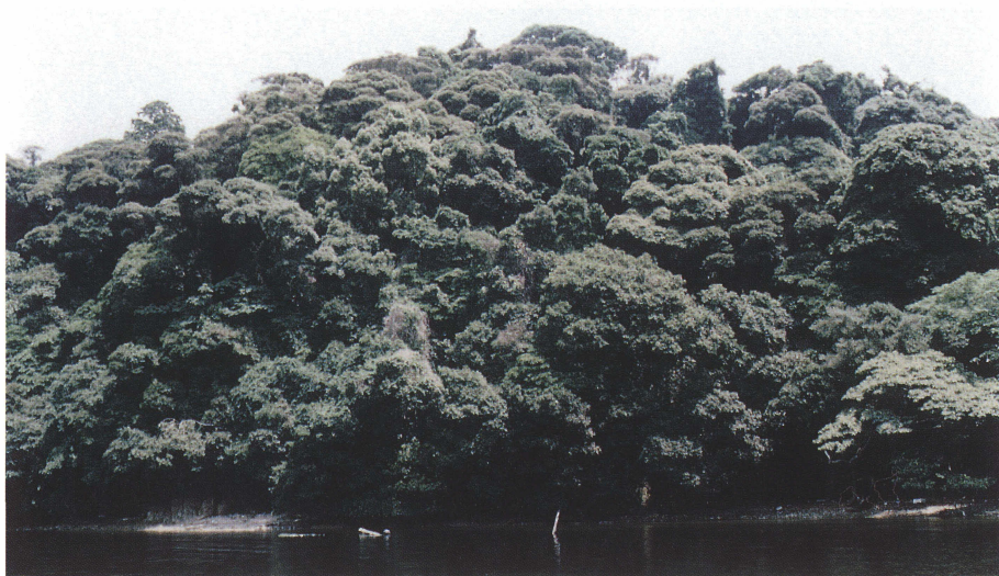
写真 3 生島の照葉樹林の外観. 全体にクズが目立つ他, 中央部にクズのツルが見える. 1995年7月30日.