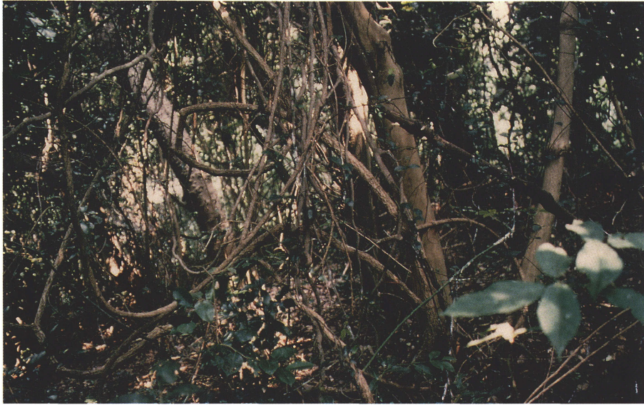
写真 5 照葉樹林内のムベのツル。1995年7月30日 服部 保撮影。