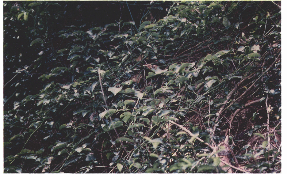
写真 6 ムベの葉とツル。2001年11月19日。