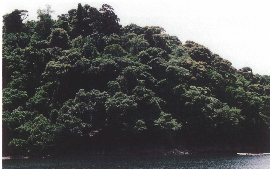
写真 2 生島の照葉樹林の外観. 樹冠の間全体にクズ(明るい緑の部分)の繁茂が顕著. 1983年5月14日 服部 保撮影.