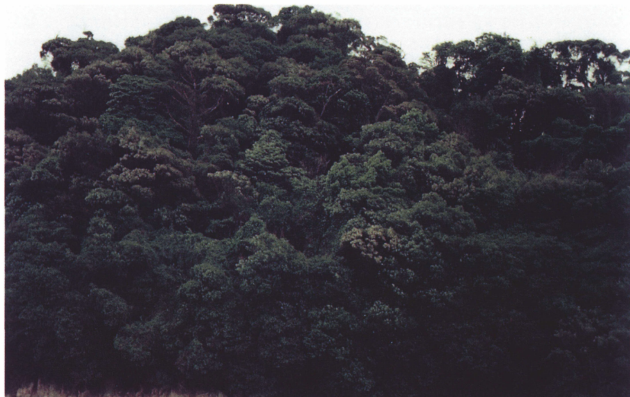
写真 1 生島の照葉樹林の外観. 中央部から右上部にかけてクズの繁茂が目立つ. 1975年1月28日.