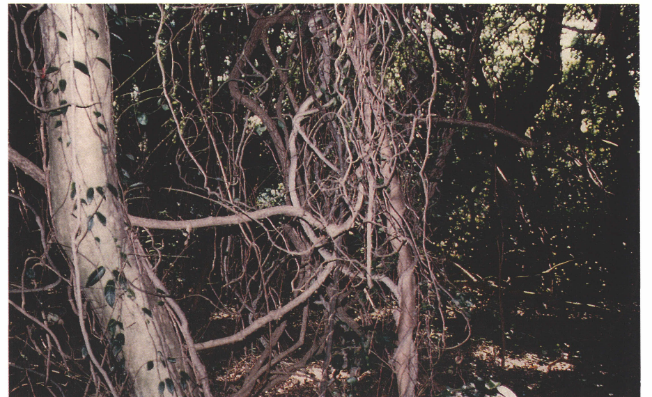
写真 8 からみつきあっているムベのツル。2002年2月16日。