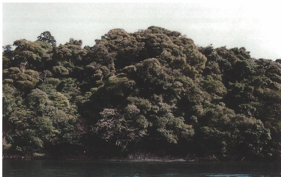
写真 4 生島の照葉樹林の外観. 中央部の他各所に樹冠の枯れ枝が見える. 2002年2月16日 服部 保撮影.