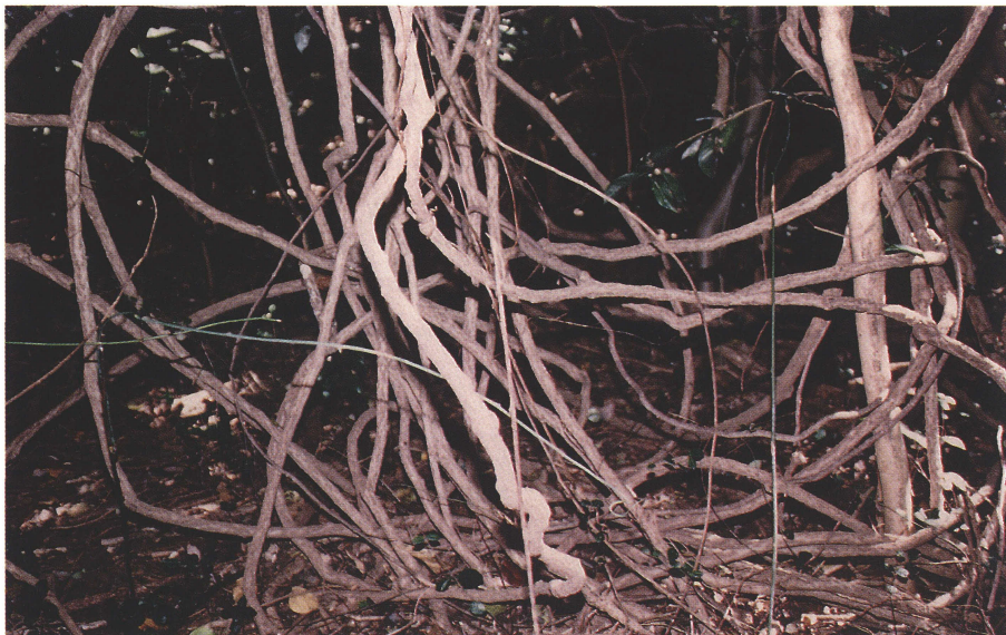
写真 7 地表部におけるムベのツルの繁茂状態。緑色の針金のように見えるものは若いムベのツル。 2001年11月19日。