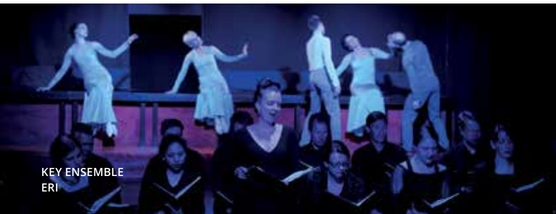
KEY ENSEMBLE ERI