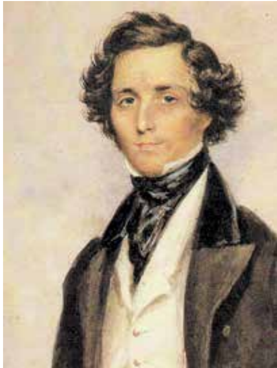
FELIX MENDELSSOHN (1809–1847)