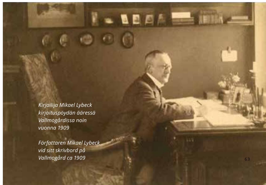
Kirjailija Mikael Lybeck kirjoituspöydän ääressä Vallmogårdissa noin vuonna 1909

Detta år är ett stort Sibeliusår, det har gått 150 år sedan kompositörens födelse. Jean Sibelius (1865–1957) musik framförs runtom i Finland och utomlands, i stora och små konserter. Överallt är man medveten om jubileet, musiken, hans liv och betydelse för Finland.