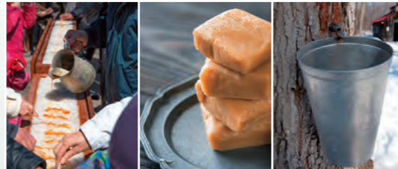
▲メイプルタフィー