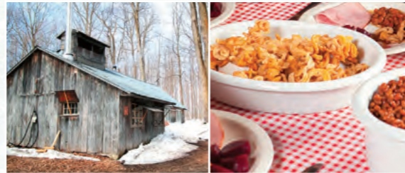
▲シュガーシャック

春にカナダを訪れる方は、一度はシュガーシャックを訪れることをお勧めします。メイプルシーズンとシュガーシャックは、大切な人、友達、子供連れの家族を訪れても、カナダの春に体験できる最高に楽しいもののひとつです。年齢を問わず、みんな一緒になって美味しいものを食べ、雪の中で過ごすひときは本当に楽しいものです。