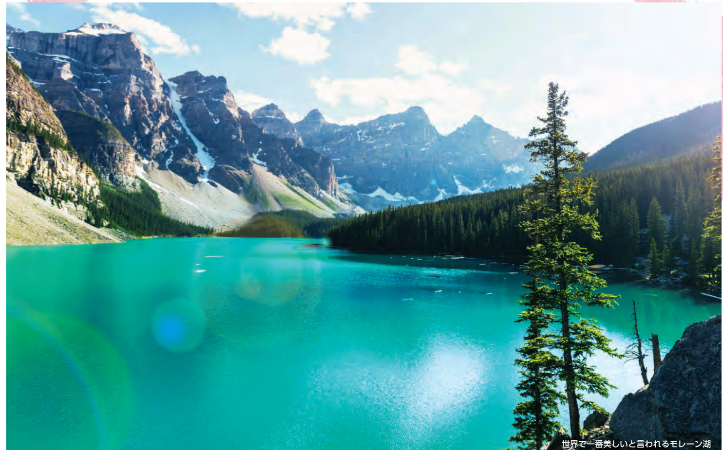
世界で一番美しいと言われるモレーン湖