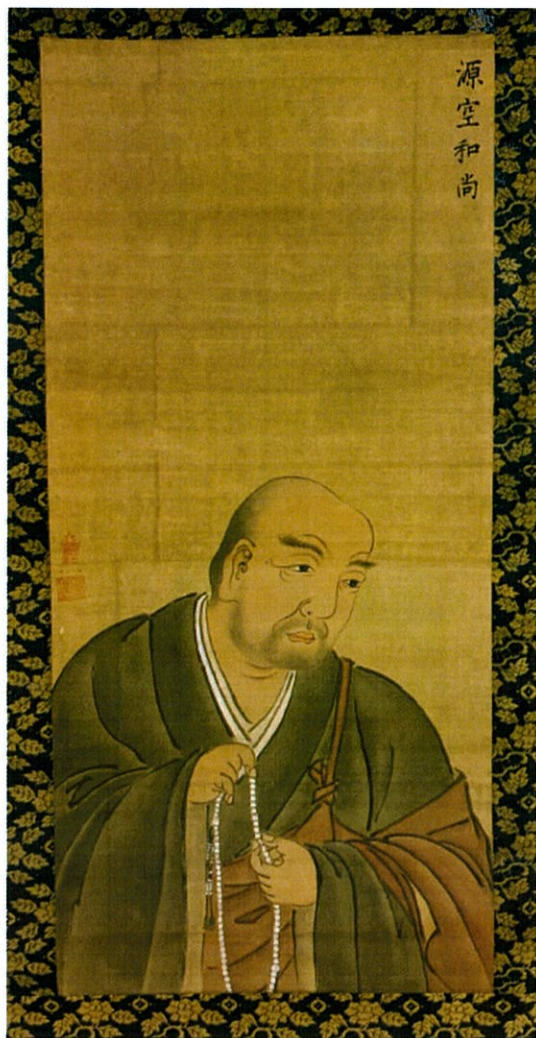
総本山誓願寺所蔵 北友雪作 法然上人像

されたのが法然上人二十五霊場巡拝の始まりと言われています。法然上人二十五霊場は、法然上人の直接のご遺跡のみではなく、上人自作の御影（画）