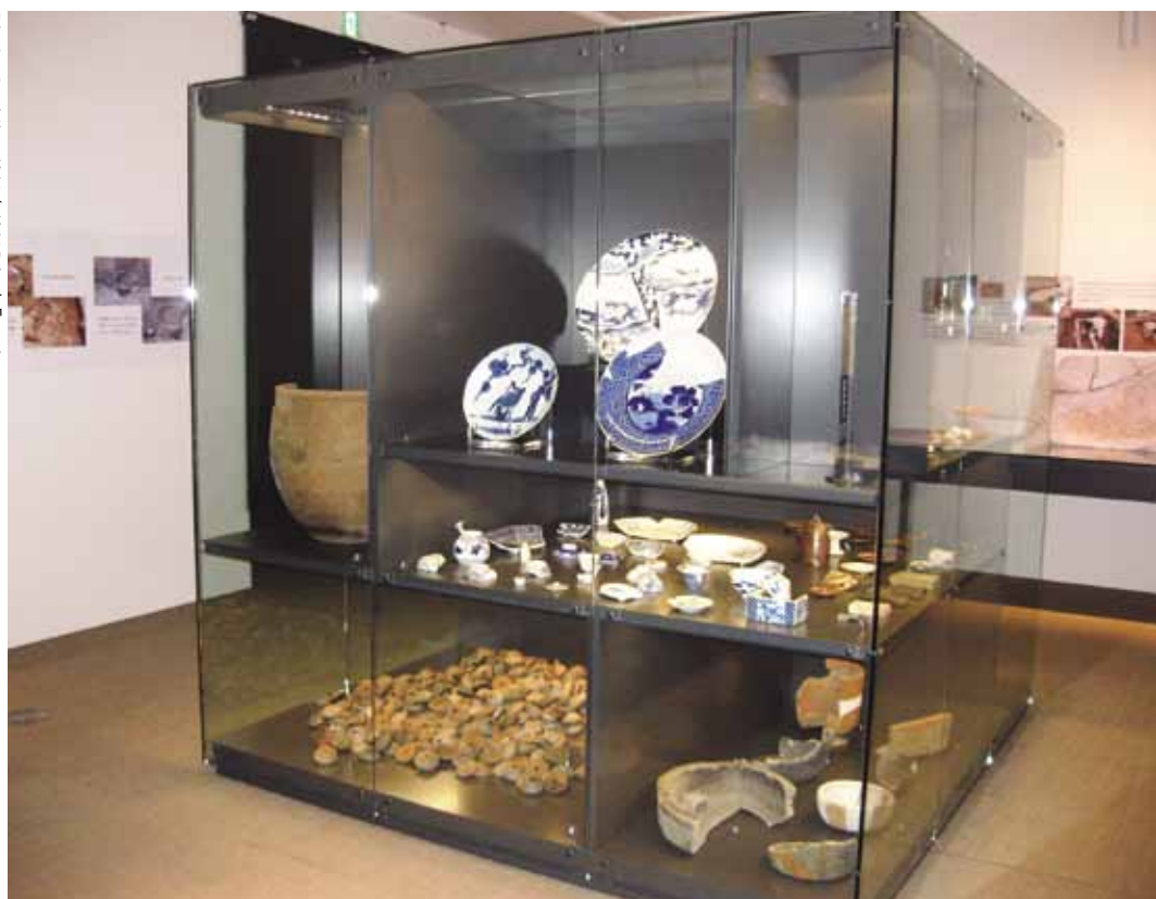
写真1/企画展示(展示室3)「たからケース」