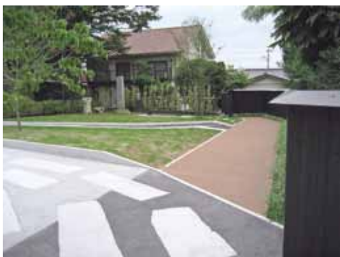
写真2/真壁陣屋跡・堀(東堀)の遺跡復元表示

堀の表示は敷地東側の公園内にあり、ウッドデッキや黒色系の舗装によって、出土場所と大きさをそのままに再現しました。