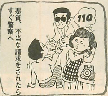
悪質、不当な請求をされたらすぐ警察へ

なお、九月十五日号の市政だよりでもお知らせしたように、貸付を受ける前に返済金がいくらになるか、自分にその借金の返済能力があるかなど、十分に考えてから借りるようにしましょう。 ※サラリーローンについてのご相談は 市役所一階の市民相談室(☎299-1111)内線四一五、四一六をお気軽にご利用下さい。 なお、調停申し立てについてのご相談は、室蘭簡易裁判所調停センター(日の出町一八二九☎467-333)へどうぞ。