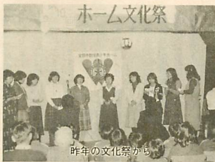
昨年の文化祭から

皆さんも若者と楽しい一日を過ごしてはいかかでしょうか。すべて若者が中心となって催されるものばかりです。 二十五日(土)は、前夜祭。十八時から開祭式、十八時三十分からサタデーナイトフィーバッシュウとして勤労青少年を対象とした若者の夕べ。 二十六日(日)は、十時から一般公開をします。お子さんからお年寄りまで家族おそろいでおいで