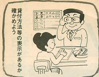
貸付方法等の表示があるか確かめよう

から貸金業者に対し貸付条件の揭示など、適正な運営について行政指導がなされ、また道においても同様の趣旨を盛り込んだ貸金業者に対する指導要綱がつくれ、道としても貸金業者に対する行政指導を強めることになりました。