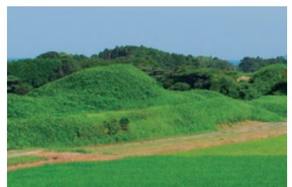
新原・奴山古墳群