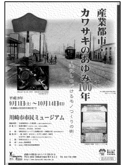
図 1 川崎市市民ミュージアム企画展 「産業都市・カワサキのあゆみ 100 年—進化し続けるモノづく りの街—」

本稿では、これまで詳しい事が分からなかった御幸煉瓦製造所製の煉瓦について紹介する。