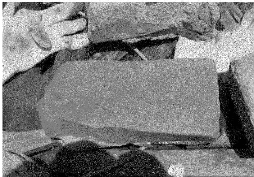
図2 増山家での煉瓦発掘の様子（平成19(2007)年5月19日）