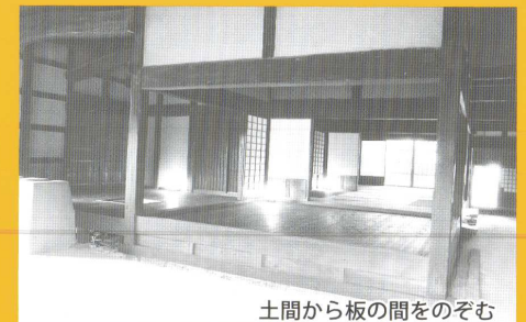
土間から板の間をのぞむ