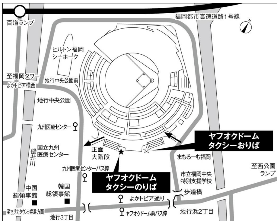
タクシー乗降場ご案内図

■ 本件に関する報道関係の方のお問い合わせ先 福岡ソフトバンクホークス株式会社 広報担当 TEL:092-847-1684 E-mail: koho@hawks.co.jp