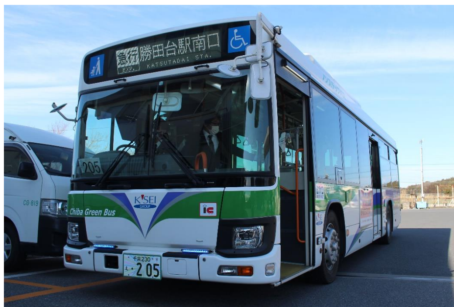
ちばグリーンバス車両

ちばグリーンバスでは、これからも地域に密着した路線網の構築を目指すとともに、安全・安心なバス輸送サービスを提供してまいります。