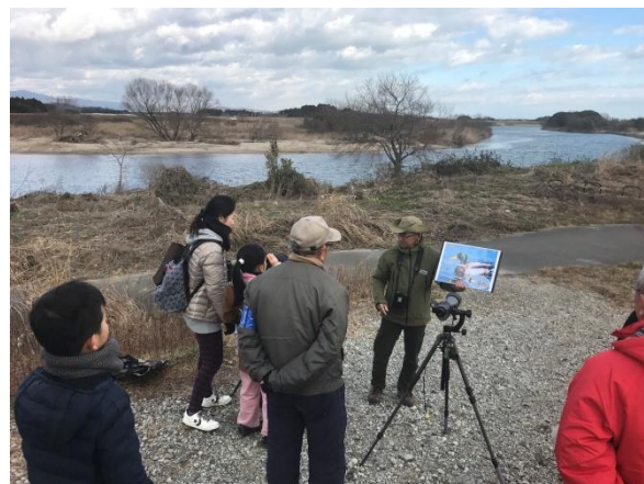
写真 3. 夏井川のカモを観察する様子