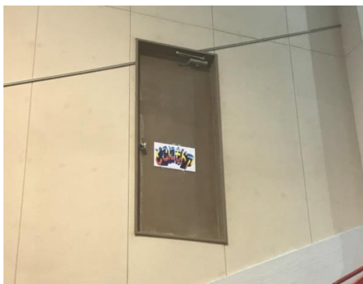
図2. ドア部分の拡大

まずは、図1をご覧ください。ドアである。しかし、ただのドアではない。拡大した写真(図2)をみるとそれが良く分かる。