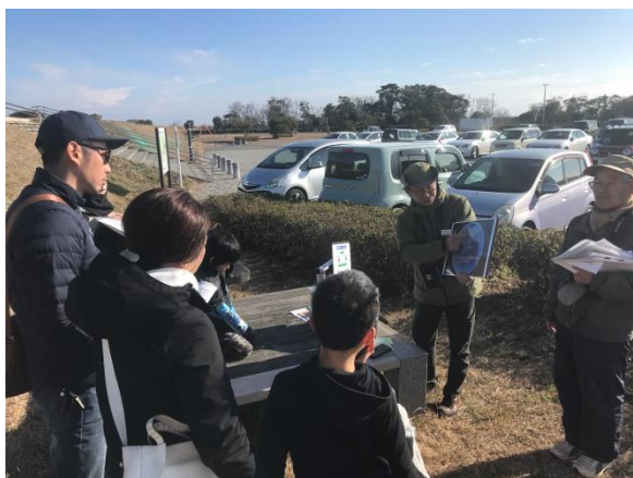
写真 2. 鳥の渡りについての説明

1月13日(月・成人の日)に今年度5回目の親子自然探訪教室が開催された。今回は「冬の野鳥を見にいこう!」というテーマで、日本野鳥の会いわき支部の方々の案内の下、夏井川サイクリング公園及び平沼ノ内の漁港に於いて野鳥観察を行った。暖冬で田圃が凍らないためハクチョウは田圃での採餌に散らばってしまっていて、例年とは異なり夏井川河畔でのハクチョウ観察は出来なかったが、シベリアやカムチャツカから渡ってきたカモの仲間や、沼ノ内の断崖で営巣しているハヤブサを観察することが出来た。