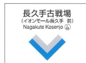
駅名看板（イメージ）