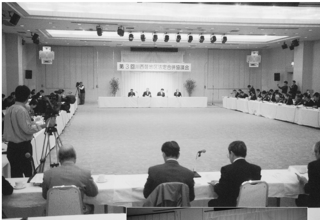
川内市で開かれた法定合併協議会の第3回会議