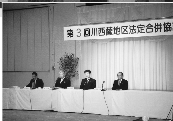
第3回川西薩地区法定合併協議会