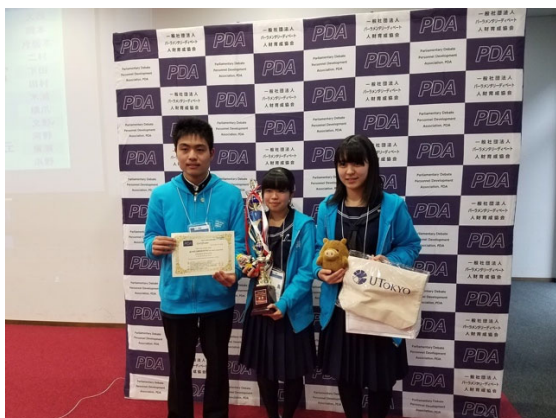
優勝：福井県立藤島高等学校