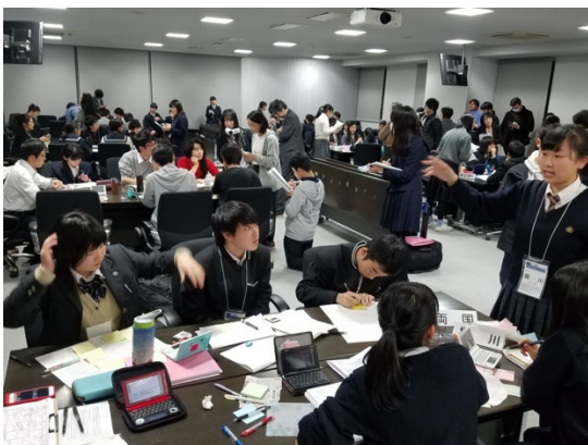
予選3 ジャッジの目を見てスピーチ

予選3の論題は「理系女子に積極的な優遇措置を与えるべきである。」です。ニュースでも話題になっている医学部の入学試験問題などにも触れながら、女性が現在どのような状況におかれているのかなどについて詳細に分析していました。