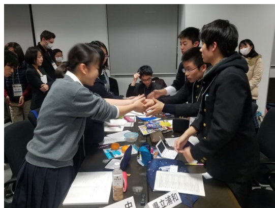
試合後は笑顔で握手