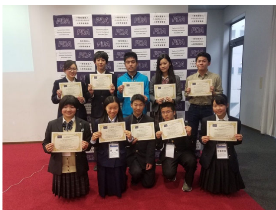
ベストディベーター賞