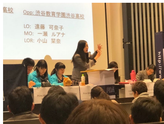
緊迫した決勝戦の様子

決勝戦、3位決定戦が終了し、表彰式が行われました。チーム賞、個人賞の授与が行われました。また、文部科学省・外務省後援 第4回 PDA 高校生パラメンタリーディベート世界交流大会（ワールドコンGRESS）への出場権を手に入れた学校も発表されました。