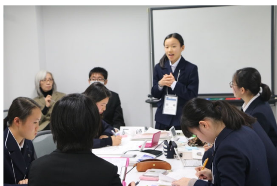
予選 1 岡崎 vs 柏陽

ついに予選が開始されました。64 チームが一斉にディベートを行います。予選 1 の論題は「修学旅行での民泊を禁止すべきである。」です。生徒たちは、中学校や高校での自身の修学旅行の様子を思い浮かべながらアイデアを出していきました。