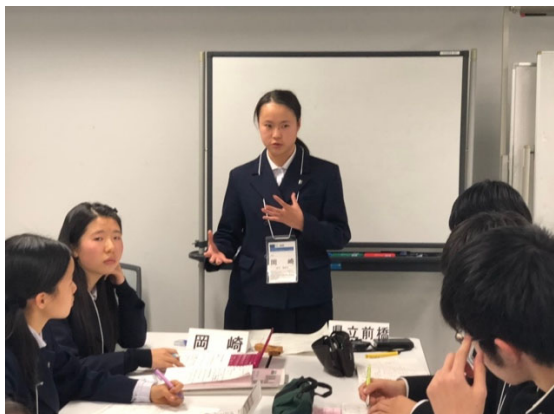
聴衆にうったえかけるようにスピーチ

予選 4 の論題は「外国人労働者受け入れ拡大は、日本に害よりも利益をもたらす。」です。外国人労働者はどのような産業に入っていくのか、どのような問題が起こりうるか、なぜ日本にメリットが発生するのかなどの観点でプレパレーションが進められました。本最終予選ラウンドはクローズ（ジャッジはその場で勝敗を公表しません。結果はコメントシートに記入され、翌日返却されます。）でした。結果は、明日までのお楽しみです。