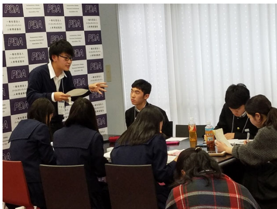
予選 2 堂々とスピーチをしています

予選 2 の論題は「年金支給開始年齢を70歳に引き上げるべきである。」です。Government も Opposition も少子高齢化などの日本の様々な背景を分析しながら議論を交わしました。年金そのものは昔からある議題ですが、生徒たちは最近のニュースも含め、民法の改正など直近の事例も用いながら深い議論を展開しました。