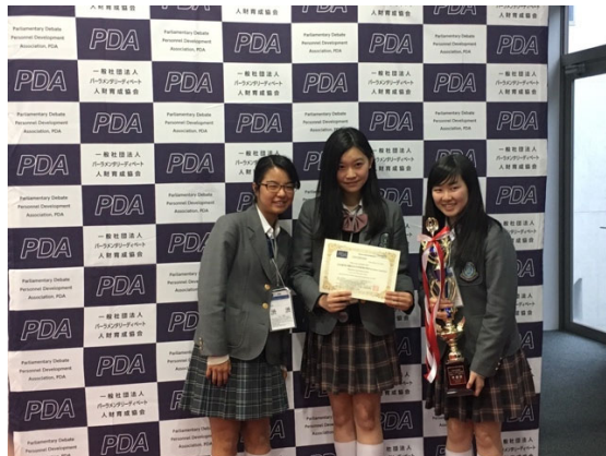
準優勝：渋谷教育学園渋谷中学高等学校