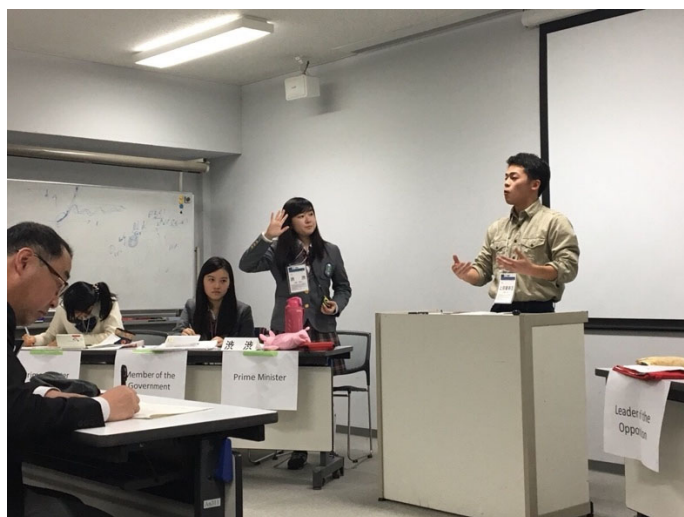
緊迫した準々決勝の様子

準々決勝は 4 つの会場で行われました。科学の発展が進んでいけばもしかするといずれ身近な存在になるかもしれないゲノム編集された食物というテーマについて、その危険性や重要性について白熱した議論を行いました。