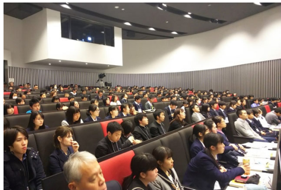
熱心に聞き入る生徒たち

予選3の論題は「理系女子に積極的な優遇措置を与えるべきである。」です。ニュースでも話題になっている医学部の入学試験問題などにも触れながら、女性が現在どのような状況におかれているのかなどについて詳細に分析していました。