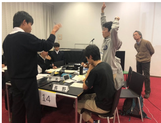
最後の力を振り絞って POI !

第 4 ラウンドが終わった頃には、大会開始時には明るかった空が真っ暗になっていました。4 ラウンド、全力を出し切った良い顔を見せ、1 日目が終了しました。