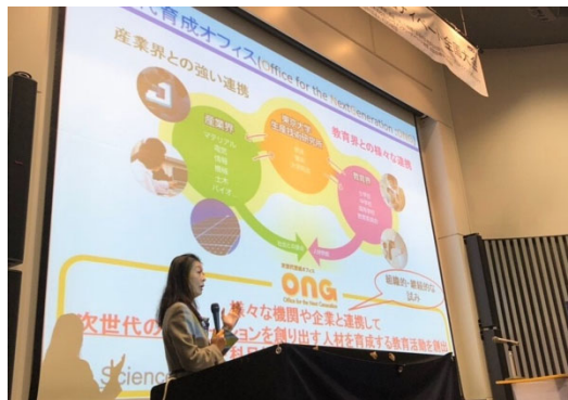
大島まり氏による予選 3 ラウンド目のテーマについてレクチャー

準々決勝の論題は「ゲノム編集で作った毒のないジャガイモは販売禁止にすべきである。」です。出場者が準備をしている間、東京大学生産技術研究所 次世代育成オフィス 室長 大島 まり教授による理系分野におけるジェンダー問題（昨日の予選 3 の論題）について解説していただきました。