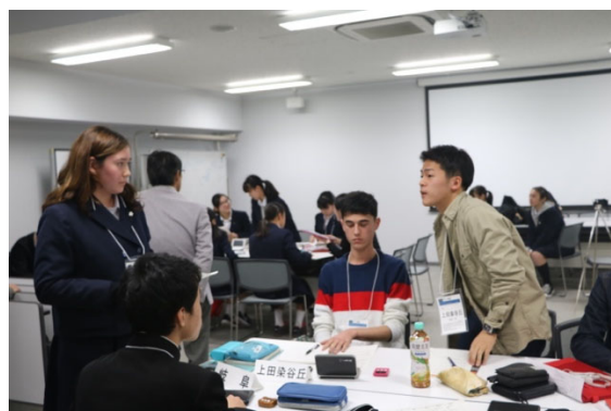
予選 1 岐阜 vs 上田染谷丘