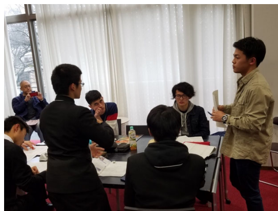
予選 2 POI で質疑応答