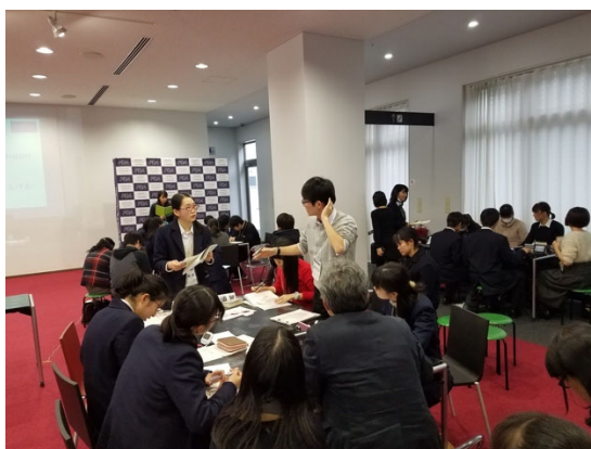
予選 2 POI に果敢にチャレンジ