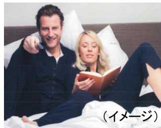
〈RECOVERY LAB PRODUCED BY VENEX〉

スポーツウェアを日常に取り入れていく「アスレジャー」なスタイル提案や、“リカバリー(=リラックス)”をテーマにした世界初のラボラトリーショップなど、従来のスポーツの枠を超えた上質でファッションブルなモノの編集はもちろんのこと、各種イベントなどのコトや、コミュニティづくりを通じて、お客さまのライフスタイルをサポートいたします。