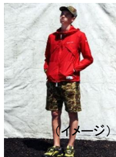
〈NOHARA BY MIZUNO〉