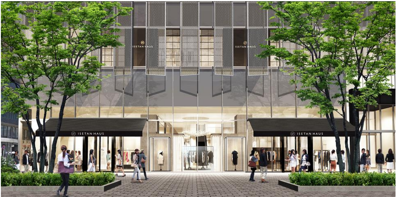
イセタンハウス外観(イメージ)

今回は、2015年10月23日(金)に発表済のストア名称やコンセプト、顧客ターゲットに加えて、具体的なフロアマップや主なブランドラインアップ、店舗環境などの詳細をお知らせいたします。