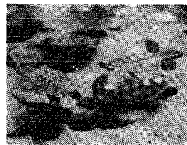
元気に泳ぐアカウミガメの子

水族館 えさ時にごぞぞ 水族館は、今月ちよと開館二周年を迎えます。また、開館二年を記念して、この二周年を水族館前訪人々には、約四千人が水族館を訪れてくれます。