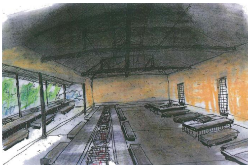
囲炉裏で旬の食材を味わうレストラン