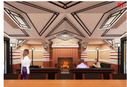
専用ラウンジ 内観