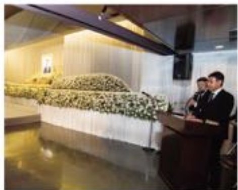
「お別れの会」で万感胸に迫る河井克行代議士の司会