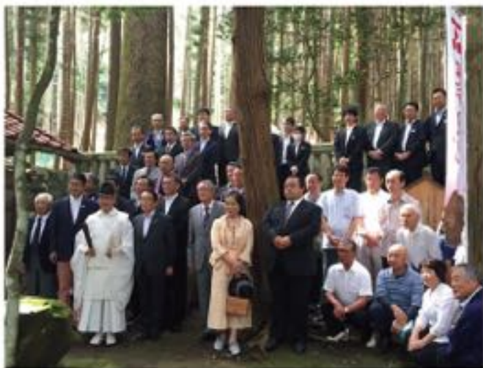
吉田地域丹比で執り行われた毛利元就の父・弘元公墓前祭。今年は弘元公生誕550年にあたります (7月16日)