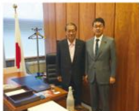
昨年十月、内閣総理大臣補佐官に任じられたお祝いに総理大臣官邸に駆けつけた鳩山邦夫・元総務大臣