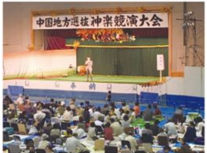
中国地方選抜神楽競演大会は戸河内簡賀の商工会青年部が盛り上げます (6月4日)