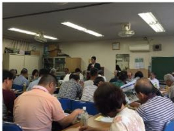
大町学区まちづくり懇談会にて、「6.29. 豪雨災害」をきっかけに始めた大町富士団地周辺の国直轄砂防事業が来春までに完了する見通しを報告（6月19日）