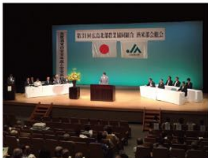
TPP 発効と外国人観光客増加により、質の高い農産物・食品の海外展開が進むことを JA広島北部酒米部会総会で酒米農家に訴えました (6月26日)