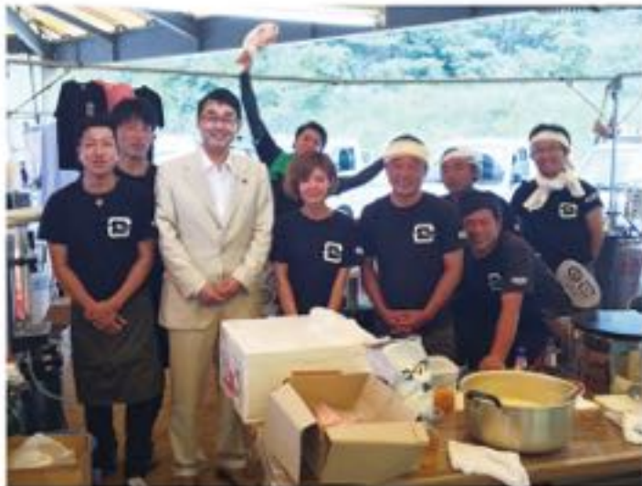
芸北神楽共演大会は芸北支部商工会青年部が盛り上げます (7月23日)