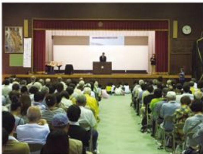
大林区で行なわれた防災訓練に国土交通省と陸上自衛隊が参加。国の参画を改正土砂災害防止法に盛り込んでから初の実施 (6月19日)