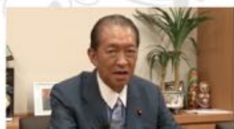
2016年6月21日 鳩山邦夫先生追悼 「河井克行への最後の激励」(5月11日収録)

河井克行代議士が長年にわたり師事した鳩山邦夫代議士が6月21日逝去されました。衆議院当選13回、文部大臣・労働大臣・法務大臣・総務大臣などを歴任された鳩山邦夫代議士の「お別れの会」は7月12日、東京都青山葬儀所において、自由民主党・鳩山家の合同開催により執り行われました。鳩山邦夫代議士は派閥を超えた議員集団「きさらぎ会」を主宰し、安倍晋三総理大臣一菅義偉官房長官を支える姿勢を明確に打ち出してきました。「きさらぎ会」幹事長を務める河井克行代議士は、鳩山邦夫代議士の遺志を守り、123名の国会議員が集う「きさらぎ会」の活動を仲間とともに続けていく決意です。