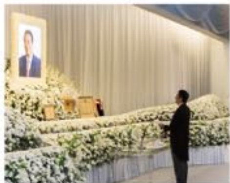
「お別れの会」実行委員長・安倍晋三内閣総理大臣の弔辞

http://kawaikatsuyuki.com 5月11日に収録した「鳩山邦夫・河井克行への最後の激励」動画をホームページで公開中