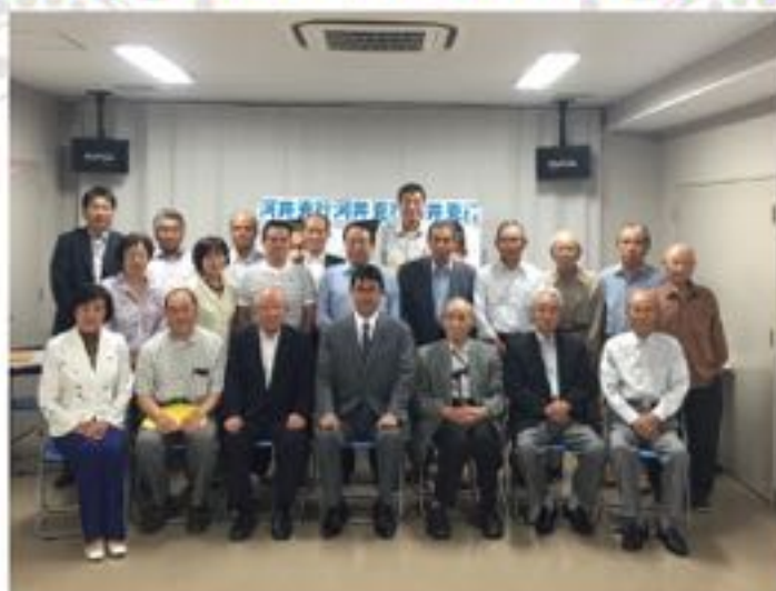
安芸高田市向原支部発足式（6月18日）