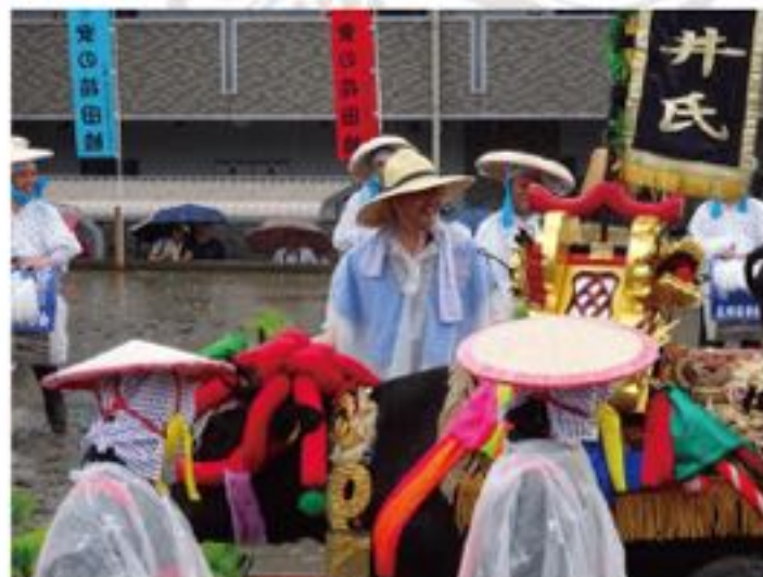
雨が降りしきる中、二年ぶりに“苗持ち”で参加した安の花田桶え（6月12日）