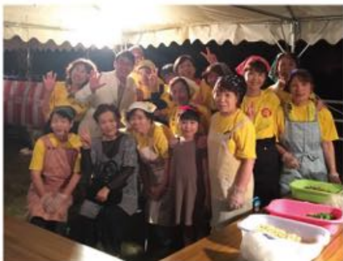
八千代ほたるまつりの主役、地域の女性たちです (6月11日)