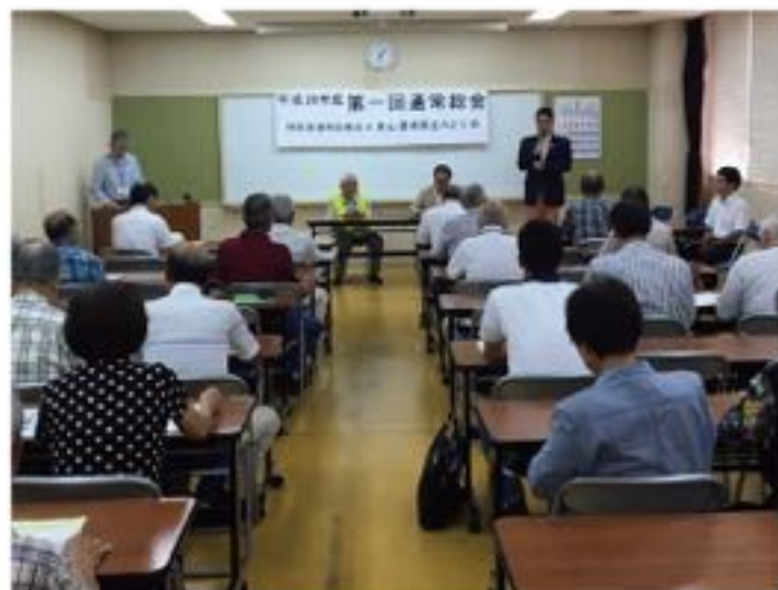
山本地区で武田山の環境保全に取り組む特定非営利活動法人「里山環境保全みどり会」を河井克行代議士は応援しています（7月16日）