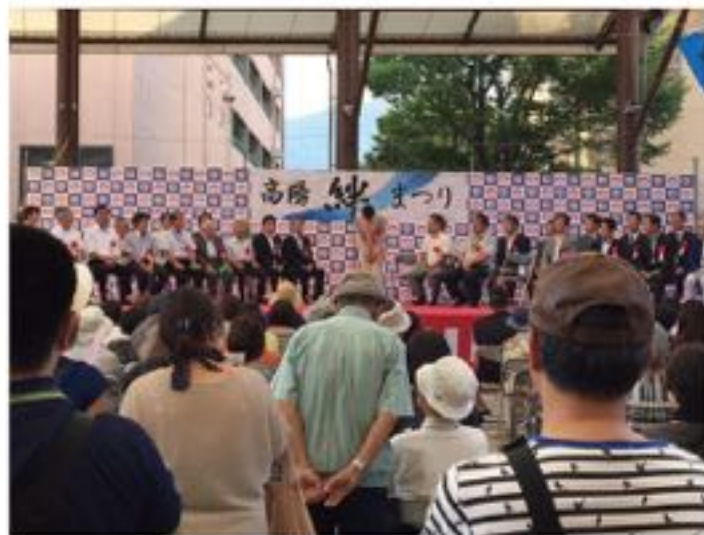
高陽絆まつり (7月23日)