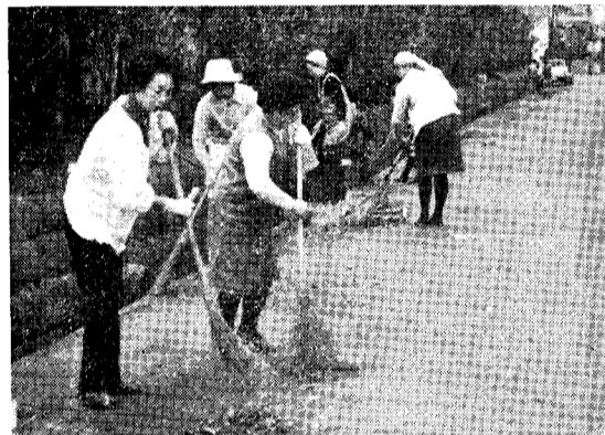
(いっせいで清掃をする八幡振興会の人たち)

職場や学校などでは実情に合った日（曜日）を清掃の日と定め、施設の内外をきれいにし、快適な環境で仕事や勉強ができるようにしましょう。