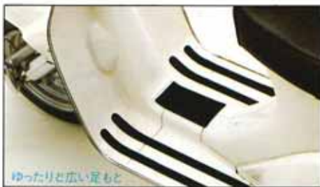
ゆったりと広い足もと