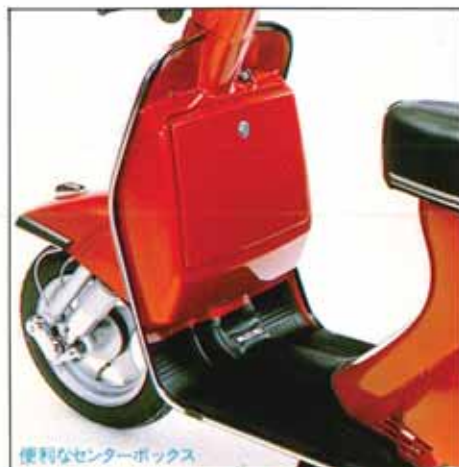
便利なセンターボックス