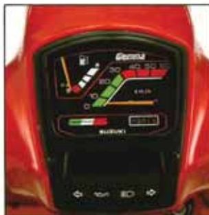
カラフルで見やすいメーター

本格派のスタイル、装備に、さらに磨きをかけた、充実のフォーマル・スクーター“ジェンマ50カスタム”。