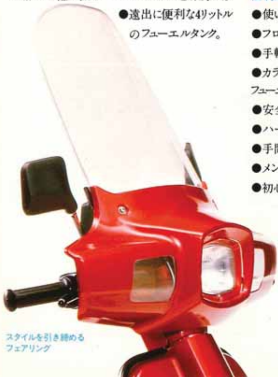
スタイルを引き締めるフェアリング