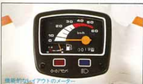
機能的なフェイスアウトのメーター