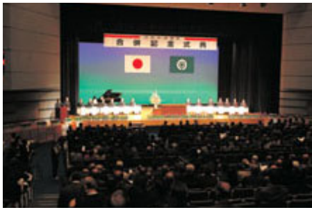
日向市・東郷町合併記念式典が2月25日、日向市文化交流センターで開かれました

日向市には、美々津から細島に至る海岸線を生かした「黒潮文化」「街の文化」が脈々と思っています。東郷地域には豊かな森林資源を生かした環境の世紀である21世紀にふさわしい「森林文化」が根付いています。地理的にも、歴史的にも、また人と人とのつながりも関係が深い日向市と東郷町の合併で、新しいまちづくりがスタートしました。日向市の人口は、6万3454人（3月1日現在）となり、面積は、336・29平方キロメートルになりました。