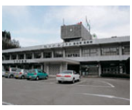
東郷町地域自治センター

合併前に東郷町であった区域には、地域自治区を設置します。地域自治区には、その区域の住民で構成する地域協議会が設置されます。