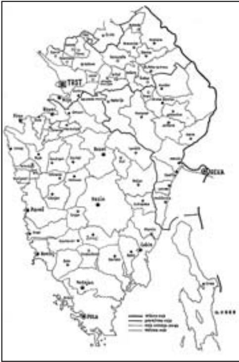
Figure 2: Administrative division of Istria, 1926–1945 (Čermelj 1945; Darovec 1992, 59), for the Municipality of Piran it applies until 1947 when the Free Territory of Trieste was established.

salt has been due to extreme quality of petola crystal clear, white and of fine taste, without any addition of sand and other impurities. Because of very high quality, »white gold« was sold further inland as well as to the rest of Europe and even the Middle East (Bonin 2001). Piran's economic development was based on production and trade in »white gold« for centuries. When Piran accepted Venetian authority as the last town in Istria in 1283, it became a part of the Venetian effort for establishing monopoly over the salt trade (Holz 2001).