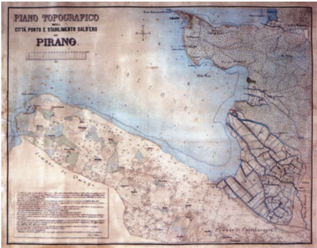
Figure 1: The Municipality of Piran in the past encompassed the Savudrija and Kaštel land registry districts (Piano Topografico ... 1882).

The most important technological milestone in their operations occurred in 1377 when they began to produce »petola« at the bottom of kavedini or crystallisation pools under the influence of salt makers from the Island of Pag in Dalmatia. Petola is a special naturally produced base from gypsum created by microorganisms, mixed with surface mud and preventing mixing of salt with mud. Afterwards, the Piran