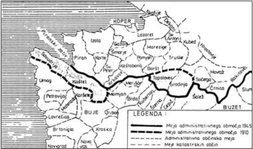
Figure 4: Section from the map from enclosure in the book Cadastre national de l'Istrie (Cadastre ... 1945; Darovec 1992, 74).

will be where the territory ends and people still speak distinctly Slovene. That's how far the organisation of our Liberation Front extended, there people themselves felt Slovenes. And we drawn the border and assessed the villages as we went. We began at the mouth of the Dragonja River in the sea from the end of the Sečovlje salt-pans, then we went along the course of this small river to the village Topolovec, then southeast under the village Pregara, towards the east above Štrped before Buzet and towards Vodice. We shook hands. There will be no more misunderstandings as to where something belongs. Perhaps we even did some work for future borders of the two republics. Who knows?... (Guček 1959; Marin 1998).