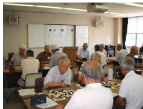
第 14 期名人戦