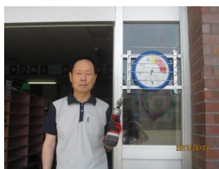
H29. 6. 23 昇降口へ熱中症予防対策 温湿度計取付作業

「S42 年 4 月 航空製造部に入社、その後、技術部の材料研究課に移動。材料関連の研究、加工プロセスの開発、維持管理に従事、定年退職、再雇用、派遣社員として長年お世話になり H27 年 3 月に退職しました」