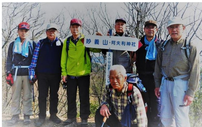
H28. 2. 27 仲間と妙義山に登山(左から 3 人目が本人)

事務局「それらの職歴にも係わらず、学校業務嘱託員をやろうと思われたのはどうしてですか」