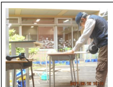
H29/6 仕事風景 (プロ大工?)

けの仕事」をとも思っていたので、すぐ応募しました。問題は営業畑の経歴で採用されるか？でしたが、木工作業が好きで現役時代から日曜大工はやっていましたし、増築もどきまではやった経験がありましたので、面接でしっかり PR しました。運よく採用になりました。「好きこそもの上手なれ」と言いますが本当にそう思います。好きな労働を最後にやれることに感謝ですね。始めてみると、汗もかかきますが冷汗も日常的にかくんですよ。いつも確認、確認の連続です。」