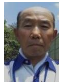
鷹嘴 利夫 H20/9 会員

毎日のゴミの分別、校内の小修繕・児童の机椅子の高さ調整・机天板の交換・蛍光灯の交換・冬の灯油給油と融雪剤(塩カル)の散布・校庭の白線ロープの交換・低木剪定と草の刈り払い・落ち葉さらい・プールサイドの目地の草刈・使用前のプール内掃除(先生、子供達と共に)・クラス毎の畑耕しとマルチ張等が定例の作業内容です。勤務は年末年始やお盆の学校休業日以外はカレンダー通りの午前中ですが、運動会や入学式・卒業式の時は前日準備等のため勤務時間が変わります。児童の授業と安全が第一ですので、仕事は子供達のいないタイミングを見計らって作業を行うのが基本です。校庭の端っこで草の刈り払いを行っていた時にもうすぐ児童の休み時間だと意識していながらも、ついぎりぎりのタイミングまでやってしまい、副校長先生が慌てて飛んできた失敗もありました。息子の通った小学校で子供達の元気な声を聞いていると、子供のことは殆んど妻任せだったなあ~と思わせられることが多いです。業務員は各校1名配置ですので基本的に単独作業です。3年目になって、やっと自分の技量・職場の手持ち工具等からどんな修繕が可能か冷静に判断できるようになったかな?と思うこの頃です。(専門的・高所作業・多人数作業は「機動班」が実施します)」