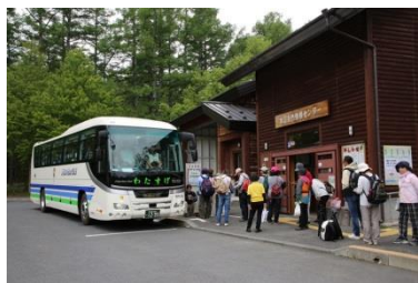
赤沼から千手が原行きのハイブリットバス

天気も晴れになり、目的の「くりん草」も見ごろで絶好の撮影条件となった撮影時には、川面を渡る涼風に当たりながら約1時間の撮影を楽しんだ。