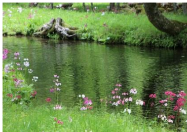
中禅寺湖に流れる川に咲くクリン草