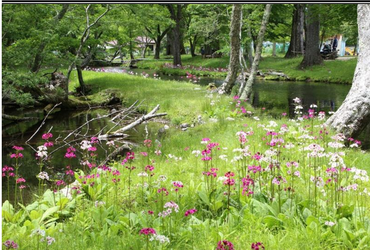
日光千手が浜 クリン草