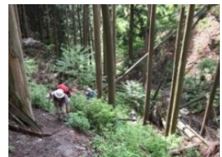
倒木が覆う登山道に登る

登山開始時に曇天で懸念された眺望が、熊鷹山では 360° パノラマまでの回復ではないものの、北方から西方まで、白根山から赤城山まで見渡せ、満足できるハイキングとなった。