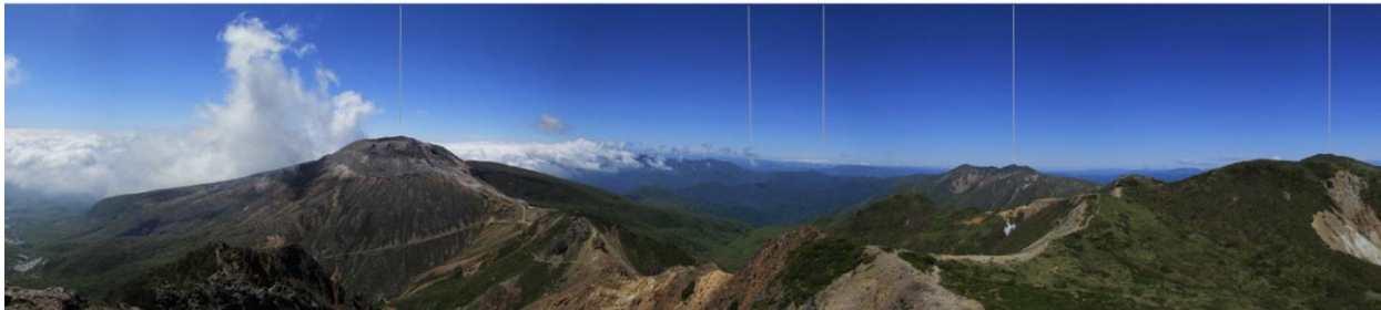
朝日岳からの眺望