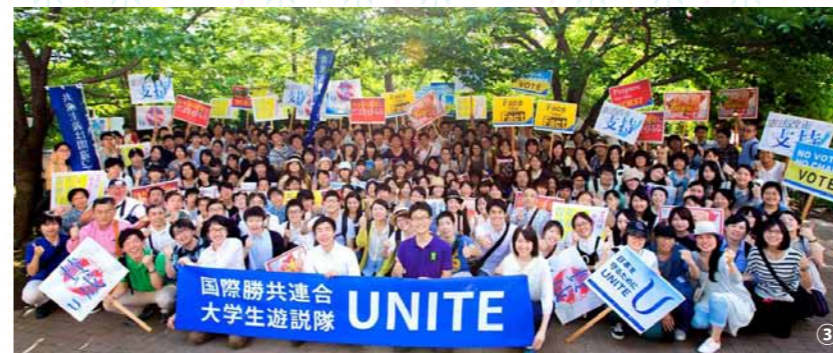
①東京・渋谷のスクランブル交差点で ②東京・渋谷のデモ行進に集まったUNITEメンバー ③熊本市内をデモ行進する「UNITE KUMAMOTO」のメンバー

今年1月、東京大学の4人の学生によって結成された「国際勝共連合 大学生遊説隊 UNITE」。その後、UNITEの活動に共鳴した大学生・青年たちが、日本各地でUNITEを結成し、演説活動を続けています。