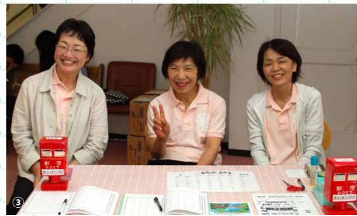
①チャリティーバザーのスタッフたち ②たくさんの人々が詰めかけたバザー会場 ③来場者を笑顔で迎えた受付スタッフ

6月4～5日の2日間にわたって、愛媛教区松山家庭教会で熊本地震の被災地支援のためのチャリティーバザーが開催されました。バザーは今回で18回目。