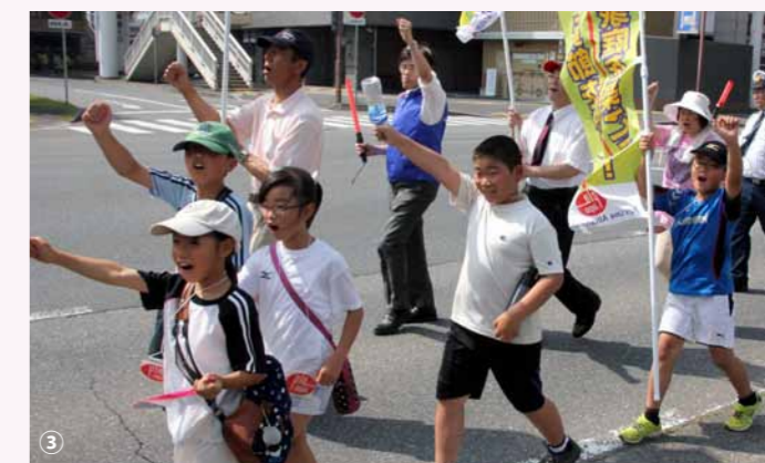
①ピュアラブラリーの参加者 ②家庭の大切さを訴える参加者 ③小学生たちも元気に行進

5月29日、晴れ渡った快晴の空のもと、「第12回茨城ピュアラブラリー&マーチ in 土浦」(主催・APTF 茨城協議会)が茨城県土浦市のJR土浦駅東口の近郊で行われ、約70人が参加しました。