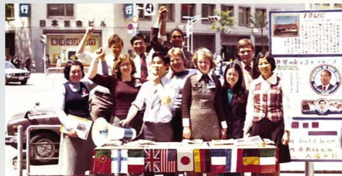
北海道に伝道の渦を巻き起こしたIOWCメンバー（1975年）

彼らを迎えるに当たって、私は40人全員と帯同伝道ができるように、人数をそろえておかなければな