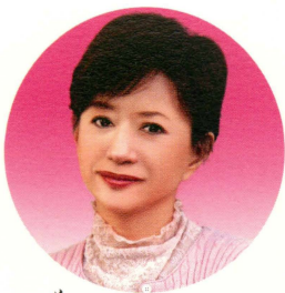
お母さん・加賀まりこ