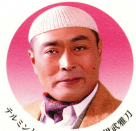
テルミンと俳句の会の先生・伊武雅刀