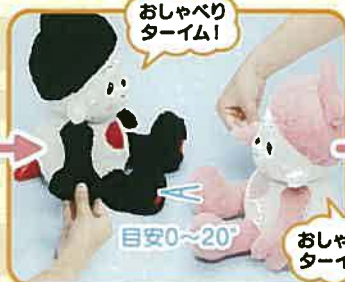
②右手あくしゅスイッチ3秒間長押し。 目安0~20°