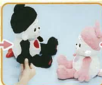
③どちらかの右手あくしゅスイッチを押す。