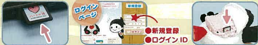
①パソコンにハートの種をセット ②専用WEBサイトで設定 ③プリモプエルにハートの種を戻す