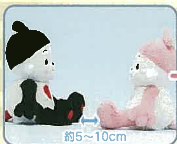
①右足同士が向き合うように向かい合わせて座らせる。 約5~10cm

※通信モードを終りようしたい時はしっぽスイッチをつまむと通常の遊びにもどります。