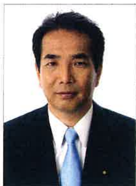
農林水産大臣 江藤 拓

この度、大日本猟友会が法人設立八十周年を迎えられたことに、心よりお祝いを申し上げます。