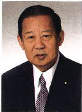
自由民主党幹事長