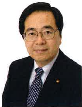
公明党幹事長 斉藤 鉄夫

一般社団法人大日本猟友会の法人設立八十周年、おめでとうございます。公明党を代表し、心よりお祝い申し上げます。