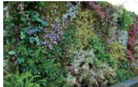
壁面緑化イメージ