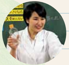
中学校教育コース 理科領域

理科領域では、専門的な知識を学ぶとともに、自分の興味がある研究や実験に取り組みながら、理科の教員として必要な技能を体験的に学ぶことができます。また、年に数回子どもたちを招いて、理科的な体験イベントを実施しており、その中で子どもたちに理科を教える楽しさを実感できることも魅力の一つです。研究室全体の交流も多く、素晴らしい先生方や仲間たちとともに、充実した大学生活を送ることができます。