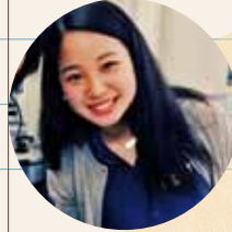
小学校教育コース 家庭領域