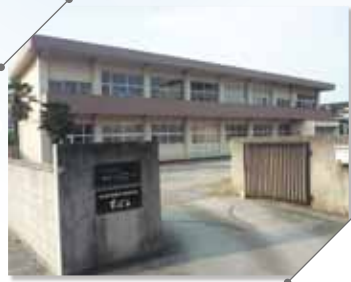
特別支援教室すばる