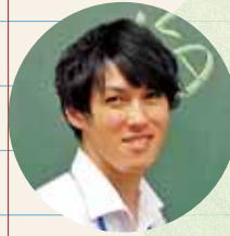
中学校教育コース 社会領域