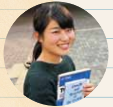
小学校教育コース 英語領域

私は、中高の英語教員免許を持った小学校教員になることを目指しています。英語を専攻することによって、将来教員になった時、小学校外国語活動により広く深い視点から授業設計・運営にあたれると思うからです。英語だらけの毎日ですが、自分の英語力が向上していくのを実感できます。また、研究室の先輩や同期のみんなととてもやりがいのある日々を過ごすことができます。来年度は留学して自分の英語力を更に高めるつもりです。