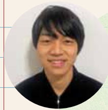
中学校教育コース 美術領域