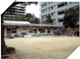
附属幼稚園 (高松園舎)