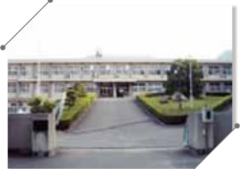
附属特別支援学校