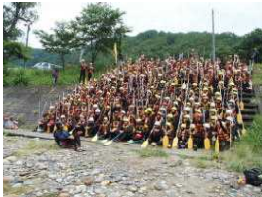
社会体験学習(修学旅行)