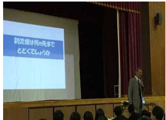
薬物乱用防止教室