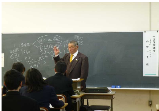
生き方学習（地域から学ぶ）